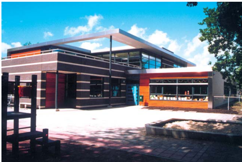
Maquette foto "Gevers Deynoot" (?)

De voorlopige richtlijn van Task Force 7 van ISIAQ, die op Healthy Buildings 2000 werd gepresenteerd, "Guidelines for indoor air quality in schools" [22] is een typisch produkt van wetenschappers. Uitermate weinig praktische informatie voor ontwerpers, maar wel veel onderwerpen waarvoor "nader onderzoek" nodig is. Verder bevat de